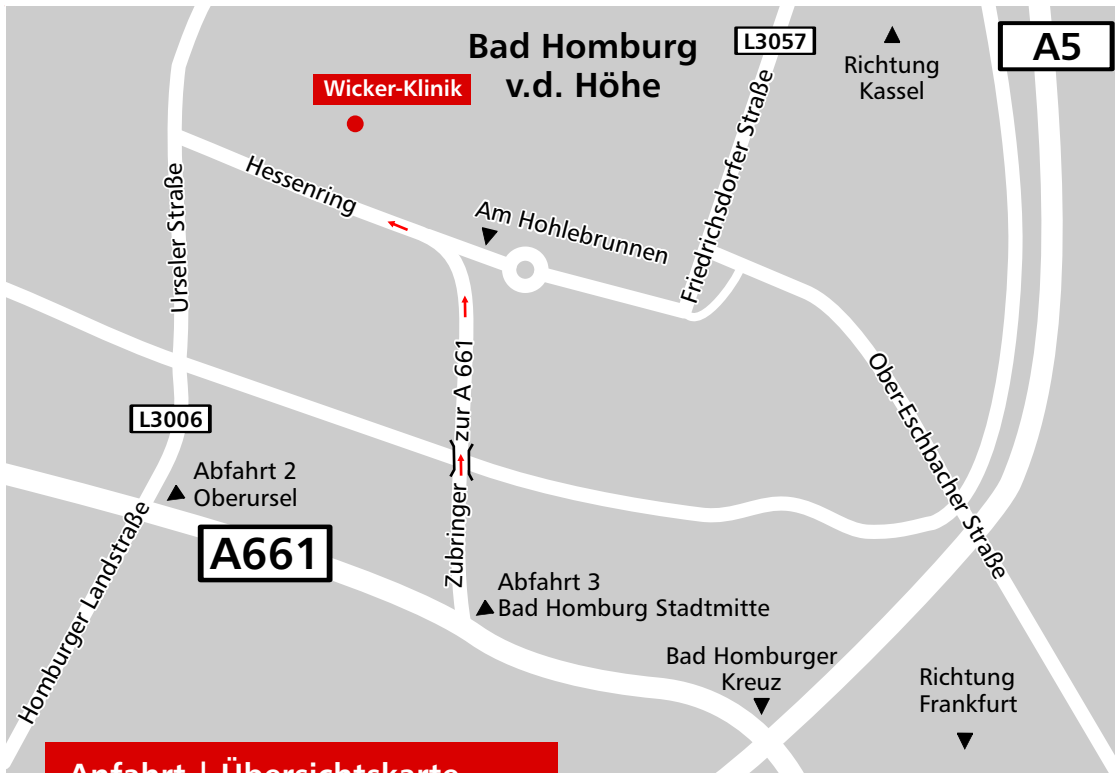
Anfahrt | Übersichtskarte

Telefon 06172 103-0 Fax 06172 103-186 E-Mail info@wickerklinik.de Internet www.wickerklinik.de